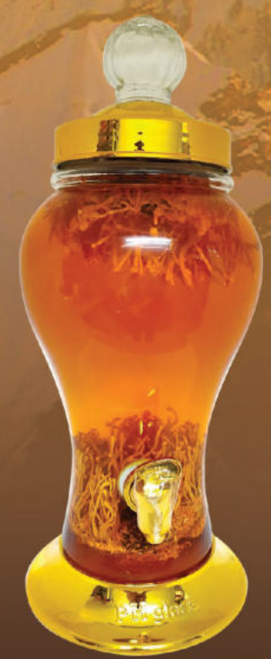
ĐÔNG TRÙNG HẠ THẢO 05 lít - 37%vol.