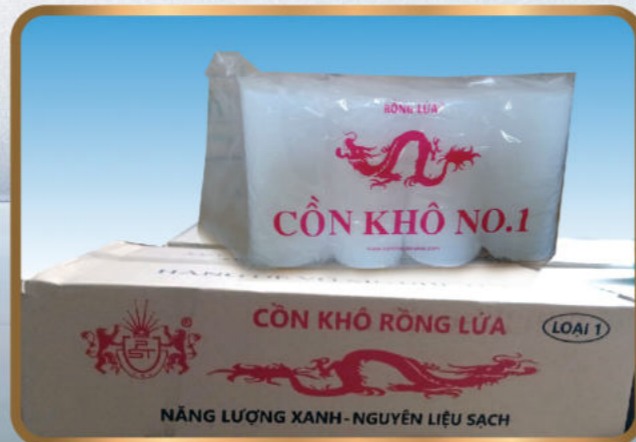
CỒN KHÔ ĐẶC BIỆT