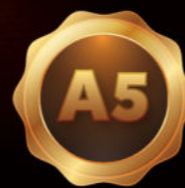
HALLIWIS BW18 700ml - 40%vol.