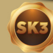
SAKE KURA 300ml - 13.5%vol.