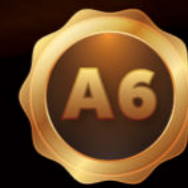
HALLIWIS BW 175ml - 40%vol.