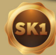
SAKE DARUMA 300ml - 13.5%vol.